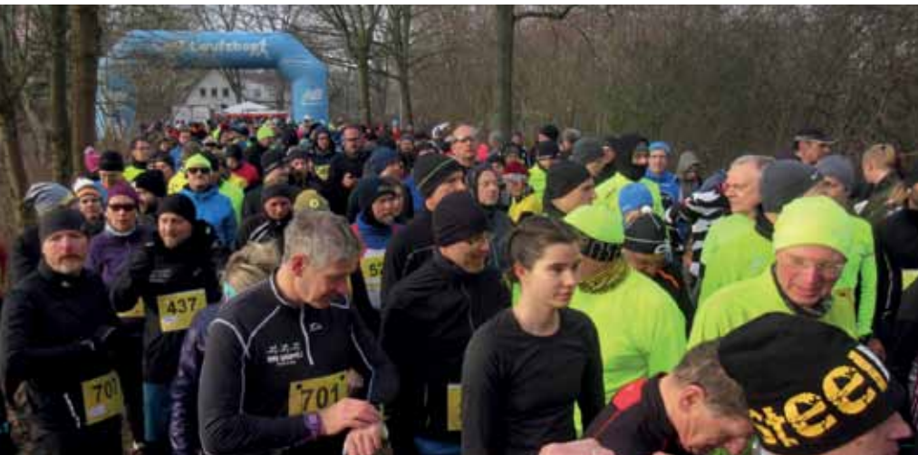
Ein Blick auf das große Starterfeld zum 7,7 Kilometer-Lauf