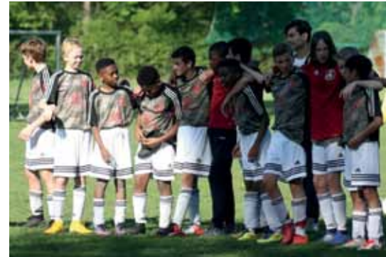
Ende gut ...