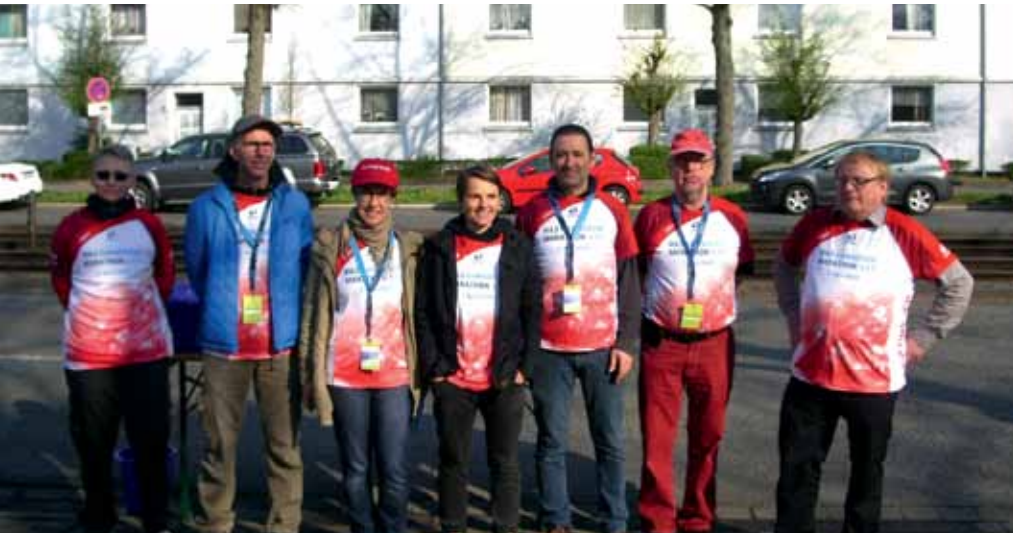
Die HelferInnen des DJK TuS Marathon