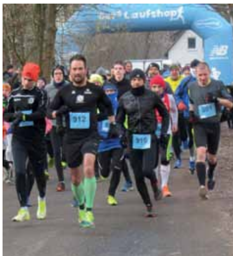
Startvorbereitungen für den 4,5 km-Lauf

Danach kamen immer mehr der 87 Läuferinnen und Läufer, die sich zuvor auf den Weg machten, ins Ziel.