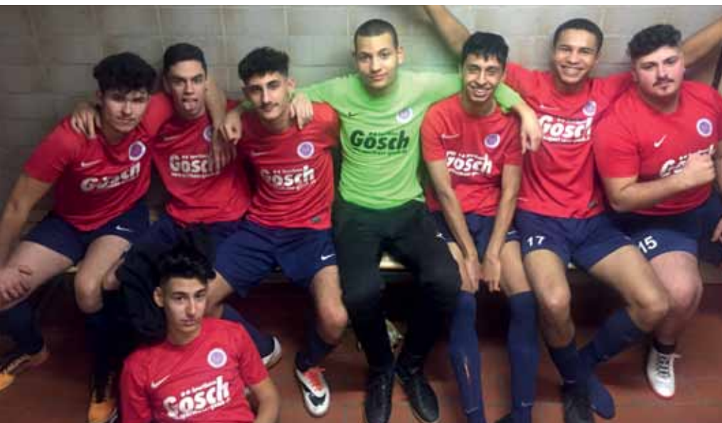
Die A-Junioren des DJK TuS Marathon