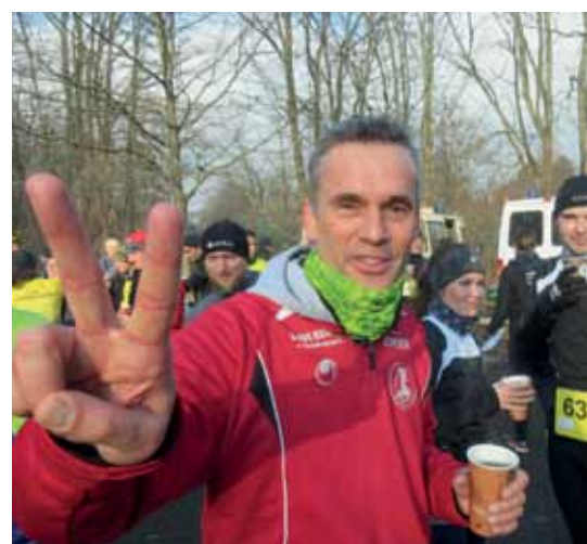
Gute Laune im Ziel

Schneller als erwartet sah ich dann schon wieder die letzte Gerade, die wieder zum Clubhaus führte. Locker lief ich dann die Uferböschung herunter und erreichte zum ersten Mal unter 40 Minuten trotz diverser Fotostopps das Ziel. Hier erwarteten uns warme Getränke und gute Laune. Es wurde deutlich, wo Urkunden abzuholen (aber