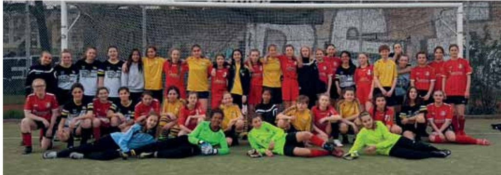
SG 74 und FSV Hansa 07

Letztendlich haben aber alle dann doch mitgezogen und Gas gegeben während der Trainingseinheiten. Die ersten Erfolge konnte man in den absolvierten Testspielen aller Teams sehen.