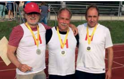
Deutscher Meister mit MTV Mannschaft