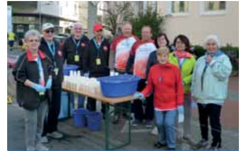
An der Bödekerstraße