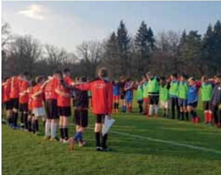
C-Jungs gegen Askania Coepenick

genervten Blicken und leidigen Diskussionen, wandelte sich der Spruch „...dann geh(t) doch zu Netto!“ irgendwann in einen Running Gag.