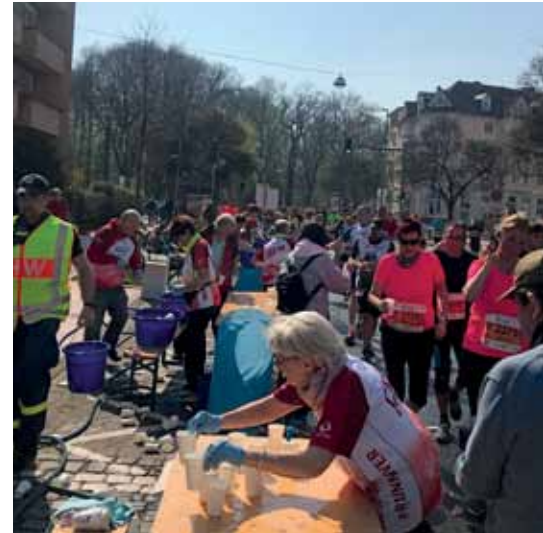
Bödekerstraße, Richtung Eilenriede