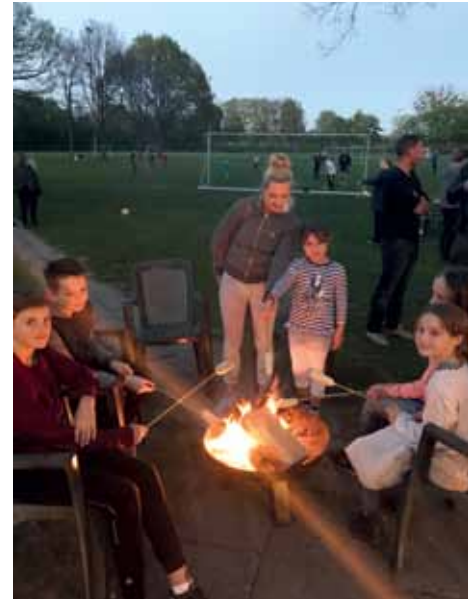
Die Kids hatten einen Riesenspaß mit Stockbrot und Marshmallows ....