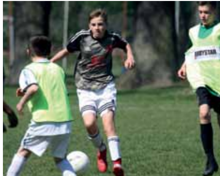
Die SG 74 mit Einsatz