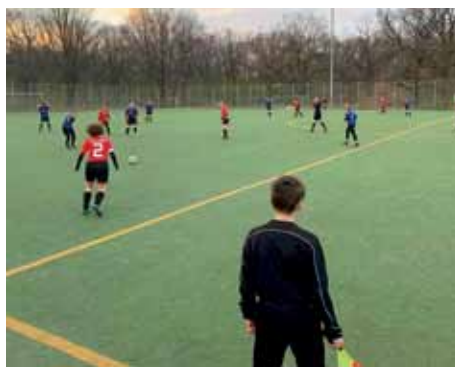
Frauen gegen Askania Coepenick