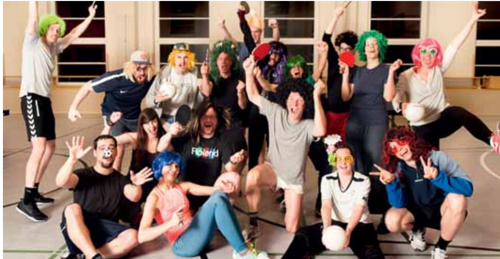
Tischtennis und Headis bei TuS-Marathon