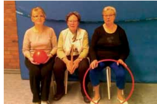
Gymnastik bei der TSG ... agil auch als Seniorin

Zum Schluss gab es für unsere fleißigen Führungskräfte kleine Geschenke und es wurde natürlich gewickelt. Rundherum