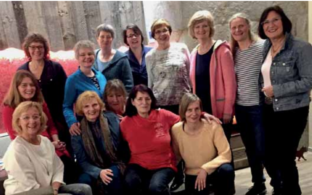
Fast alles gut