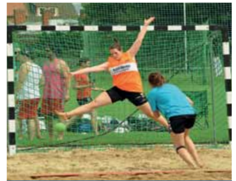
... aber auch sportliche Höchstleistungen