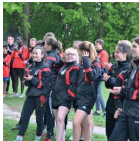
Buntes Spektakel auf der 74-Anlage