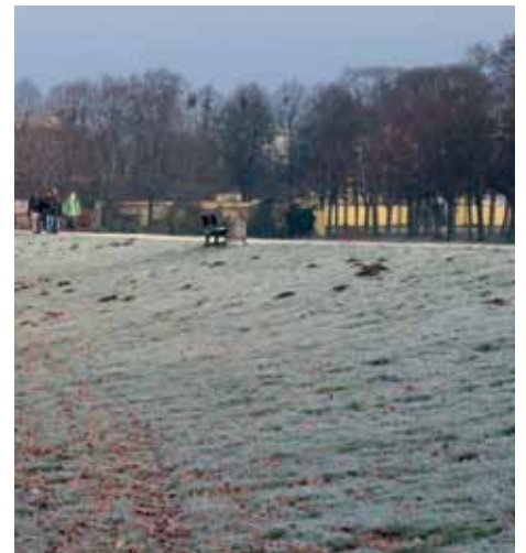
Auch 2019 gab es wieder etwas Schnee