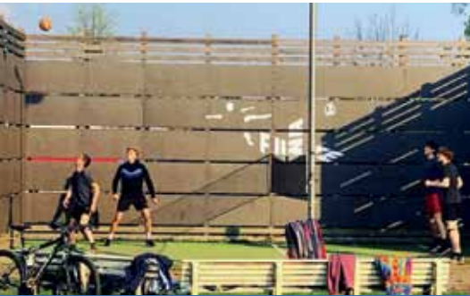
Frühlings-Cup in der Fuwate-Box