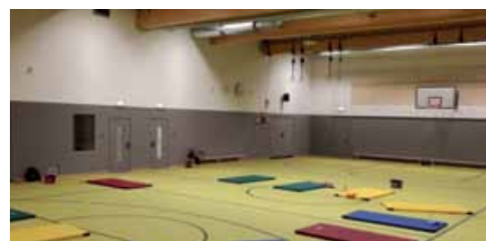
Die neue Halle in der Grundschule am Welfenplatz