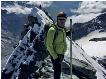
Peter ganz oben