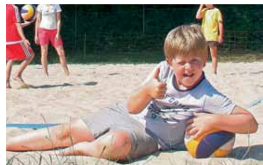
Beachvolleyball bei der SG 74 – geil!