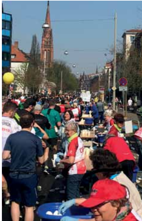
Bödekerstraße mit Dreifaltigkeitskirche

Treffpunkt war um 7.45 Uhr. Durchfahrts- und Parkscheine waren für die Auswärtigen verteilt, aber wo konnte man parken? Besser als gedacht, klappete alles bestens und alle waren pünktlich da. Mit dem Wetter hatten wir mal wieder Glück. Wir standen anfangs im Schatten und der Wind war recht kühl. Da kam auch schon der Materialwagen und alle waren mit dem Auspacken und Aufstellen der Tische und Bänke beschäftigt. Man arbeitete sich warm. Wo war das Maßband? Genau 3 m Abstand zum nächsten Tisch musste unbedingt eingehalten werden. Das neue Iso-Getränk „Maxxprolosion“ musste angerührt werden. Dieses Mal hatten wir zusätzlich Coca-Cola und Apfelschorle. Als alles an Ort und Stelle stand, folgte die verdiente Frühstückspause / Stärkung und dann ging's auch schon los.