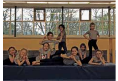
Die kleinen Sträflinge posieren für die Kamera

schen wir alle schon recht gut, auch unsere Handstände werden immer besser. Die nächsten Herausforderungen können kommen!