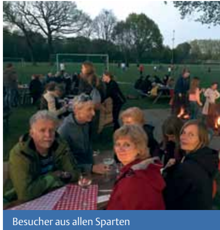
Besucher aus allen Sparten

Toll war auch das „Dessert“ mit Kaffee und Kuchen-Buffer, welches vom Fußball-Osterturnier übrig geblieben war!