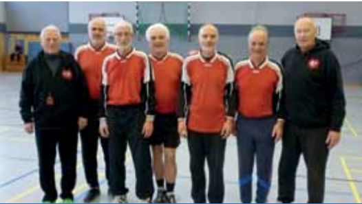
Bei unserem Hallenturnier in Bothfeld