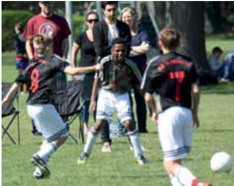
Ein lebendiges Turnier