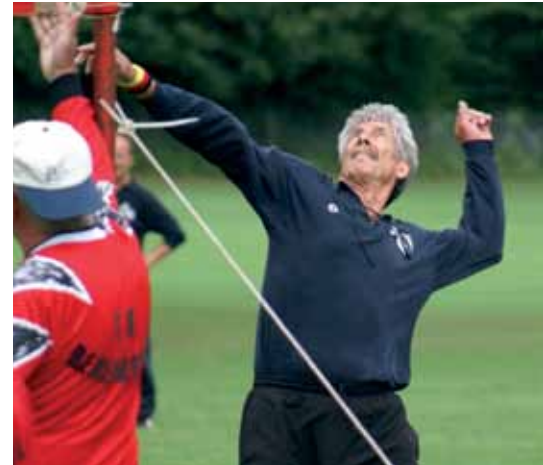
Dynamik bis ins Alter