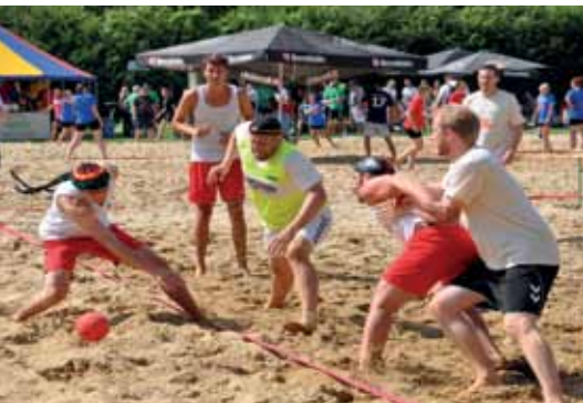
Impressionen aus den letzten Jahren