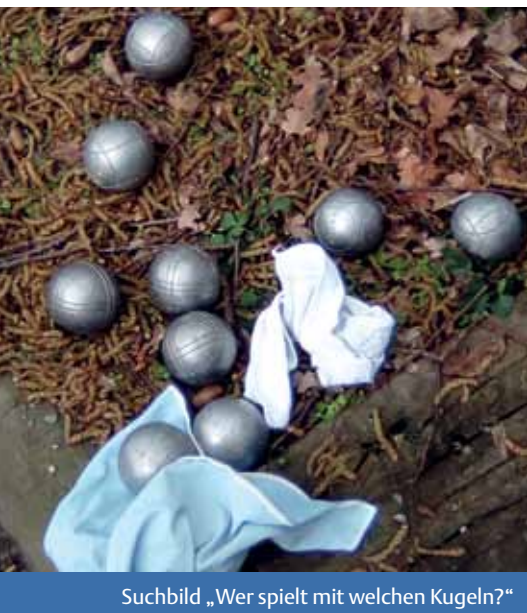
Suchbild „Wer spielt mit welchen Kugeln?“