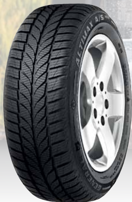
ALTIMAX A/S 365