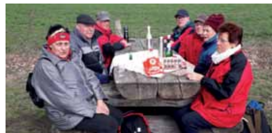
Auf Oldie-Fahrt im Frühling 2019

Wir, die Ü 70, möchten uns hier nicht einbringen und bleiben unter uns. Ab