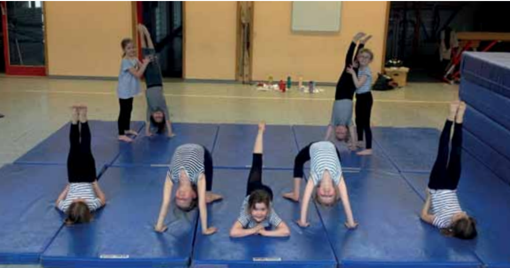
Handstand, Brücke und Kerze sind eine leichte Übung für die Kinder