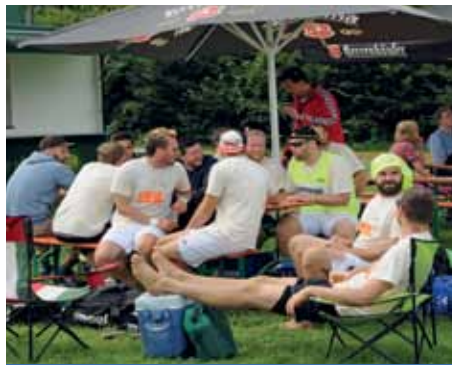
Party gehört dazu ...